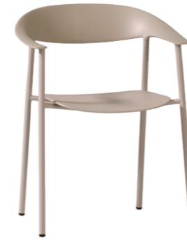
— Armchair Sillón