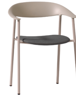
— Armchair with upholstered seat Sillón con asiento tapizado