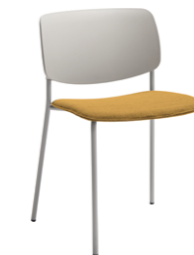
Upholstered seat Asiento tapizado