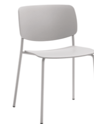
4 leg frame Pie 4 patas