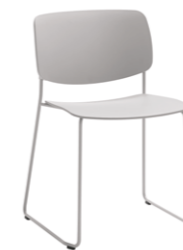
Sled frame Base trineo