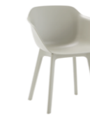
– 4 plastic leg frame Pie 4 patas de plástico