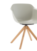
– 4 spoke wooden swivel base Base giratoria 4 radios de madera