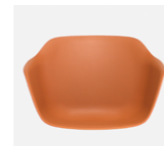
– Plastic monoshell Carcasa de plástico