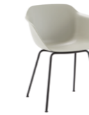
– 4 steel leg frame Pie 4 patas de tubo