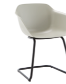
– Cantilever base Pie patín