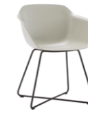
– Sled frame Base varilla