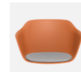
– Plastic monoshell + upholstered seat Carcasa de plástico + asiento tapizado