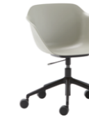
– 5 spoke aluminum swivel base Base giratoria de 5 radios de aluminio + casters / ruedas + gas lift / gas