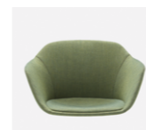
– Upholstery monoshell Carcasa tapizada