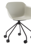
– 5 spoke steel swivel base Base giratoria de 5 radios + casters / ruedas