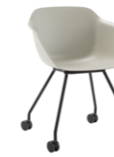
– 4 leg frame Pie 4 patas + casters / ruedas