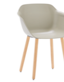
– 4 wooden leg frame Pie 4 patas de madera