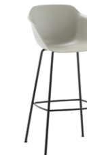
– 4 leg frame armchair Sillón 4 patas high / alto