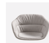
– Upholstery monoshell soft Carcasa tapizada soft