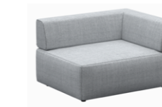
– Corner backrests (left) Respaldos esquina (izquierda)

– Sizes / Tamaños 75x75cm / 95x95cm / 75x95cm / 75x120cm / 95x120cm