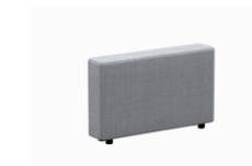
– Arms width 20cm Brazos ancho 20cm

– Sizes / Tamaños 75x75cm / 95x95cm / 75x95cm / 75x120cm / 95x120cm