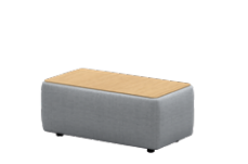
– Rectangular tables Mesas rectangulares

– Sizes / Tamaños 75x95cm / 50x75cm / 50x95cm