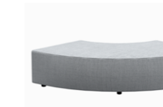
– 90° curved pouf 75cm Pouf curvo 90° 75cm

– Sizes / Tamaños 75x75cm / 95x95cm / 75x120cm / 95x120cm