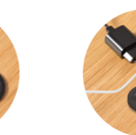
– On top schuko socket + USB-A + USB-C Enchufe de sobremesa + USB-A + USB-C