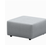
– Square seat bases Bases cuadradas

– Sizes / Tamaños 50x50cm / 75x75cm / 95x95cm