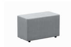
– Arms width 50cm Brazos ancho 50cm

– Sizes / Tamaños 75cm (deph / fondo) / 95cm (deph / fondo)