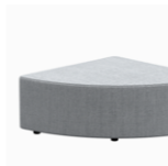
– 90° round corner seats Asientos esquina 90°

– Sizes / Tamaños Ø50cm / Ø90cm / Ø120cm