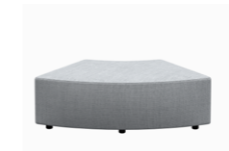
– 60° curved pouf 75cm Pouf curvo 60° 75cm

– Sizes / Tamaños 75x75cm / 95x95cm / 75x120cm / 95x120cm