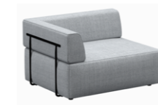
– Corner backrests (right) Respaldos esquina (derecha)

– Sizes / Tamaños 75x75cm / 95x95cm / 75x95cm / 75x120cm / 95x120cm