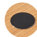
– Wireless induction charger Cargador inalámbrico por inducción