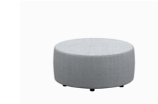
– Circular poufs Poufs circulares

– Sizes / Tamaños Ø50cm / Ø90cm / Ø120cm