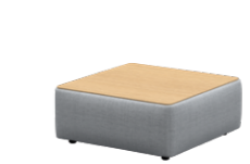
– Square tables Mesas cuadradas

– Sizes / Tamaños 75x75cm / 95x95cm / 75x120cm / 95x120cm