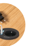
– Plastic cable grommet with cover Pasacables redondo con tapa de plástico