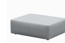
– Rectangular seat bases Bases rectangulares

– Sizes / Tamaños 50x50cm / 75x75cm / 95x95cm