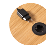
– On top schuko socket Enchufe de sobremesa