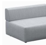
– Backrests Respaldos

– Sizes / Tamaños 75x95cm / 50x75cm / 50x95cm