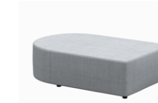
– Seat bases w/ circular end Bases con extremo redondo

– Sizes / Tamaños 75x95cm / 75x120cm / 95x120cm