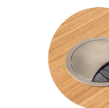
– Brushed aluminum grommet with cover Pasacables redondo con tapa de aluminio cepillado