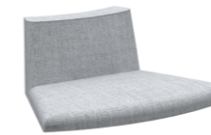
Seat w/convex backrest 45° Asiento con respaldo convexo 45°