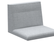
Seat with high backrest Asiento con respaldo alto