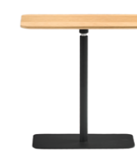
Rectangular side table Mesa auxiliar rectangular