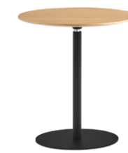
Side table Ø40cm Mesa auxiliar Ø40cm