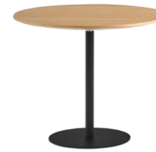
Side table Ø60cm Mesa auxiliar Ø60cm