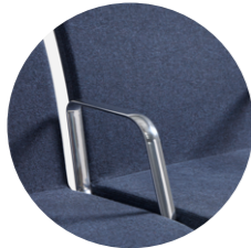
Intermediate arm Brazo intermedio