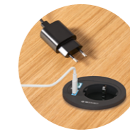
On top schuko socket + USB-A + USB-C Enchufe de sobremesa + USB-A + USB-C