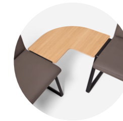
Connecting top 90° Mesa de unión 90°