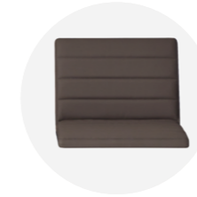
Horizontal stitching upholstery Tapicería con costuras horizontales Optional / Opcional