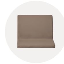
Upholstered seat + backrest Asiento tapizado + respaldo