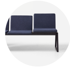
Higher seat for users with reduced mobility Elevador de asiento para usuarios con movilidad reducida