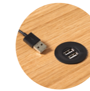
USB charger with 2 ports Cargador USB con 2 puertos