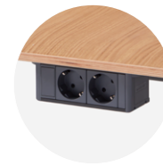
Power box with 2 Schuko plugs Caja con 2 enchufes Schuko