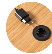
On top schuko socket Enchufe de sobremesa