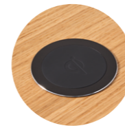
Wireless induction charger Cargador inalámbrico por inducción