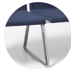
Intermediate leg Pata intermedio