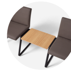
Connecting top 180° Mesa de unión 180°