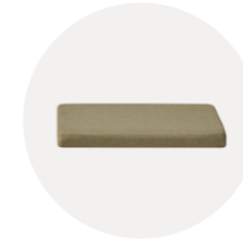
Upholstered seat Asiento tapizado