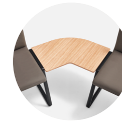
Connecting top 120° Mesa de unión 120°