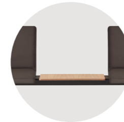
One seater tabletop Mesa de 1 plaza