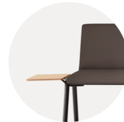
End side tabletop Mesa extremo lateral