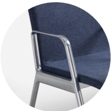
End arm Brazo final