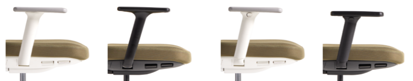
- Fix arms with width adjustment. Available in white or black. Brazos fijos con ajuste de anchura. Disponibles en blanco o negro.