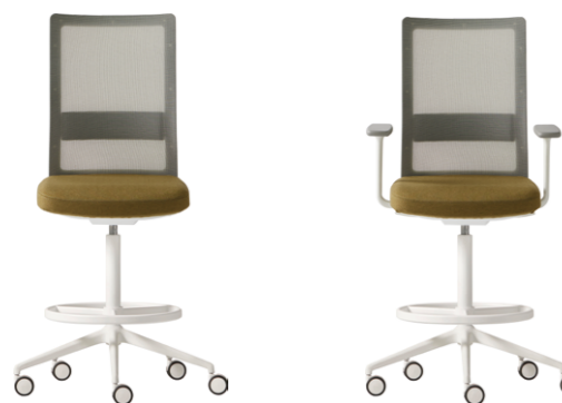
- Stool Taburete

Gas lift / Elevación a gas Gas lift + Synchro / Elevación a gas + Sincro