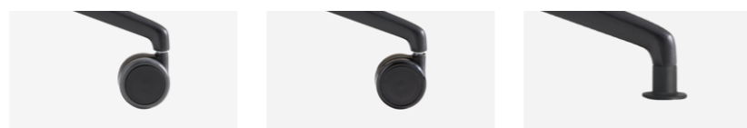
- Soft tread Rueda blanda