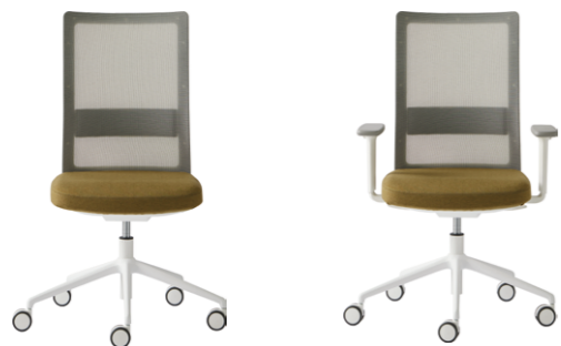
- Task chair Silla de trabajo