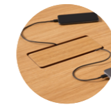
Cut-out with lid for top access Recorte con tapa practicable para acceso superior