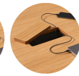
Custom cut-out on tabletop Recorte a medida en encimera