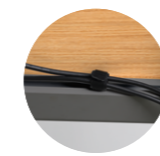
Velcro cable clamp Abrazadera de velcro para cables