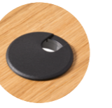
Brushed aluminum grommet with cover Pasacables redondo con tapa de aluminio cepillado