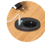
On top schuko socket + USB-A + USB-C Enchufe de sobremesa + USB-A + USB-C