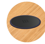
Wireless induction charger Cargador inalámbrico por inducción