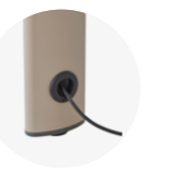
Column for cable management Columna para gestión de cableado