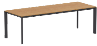
Rectangular tables Mesas rectangulares