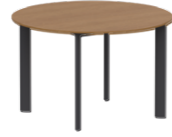
Round tables Mesas redondas