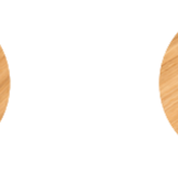
Plastic cable grommet with cover Pasacables redondo con tapa de plástico