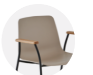
Wooden arms Brazos de madera