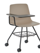
4 leg frame + casters + basket + writing tablet Pie 4 patas + ruedas + cesto + pala escritura