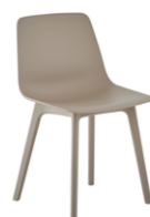
4 plastic leg frame Pie 4 patas de plástico