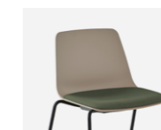
Fix upholstered pad Panel de asiento fijo