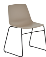
Sled base Pie de varilla