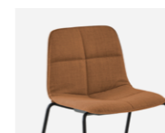
Quilted upholstery Tapizado quilted