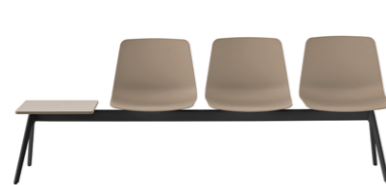
Bench 2-5 seater Banco 2-5 plazas