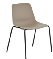
4 leg frame Pie 4 patas