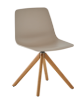
Wooden swivel base Base madera giratoria