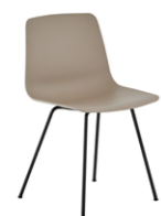
4 leg frame non stackable Pie 4 patas no apilable