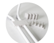
Linking clips Clips de unión