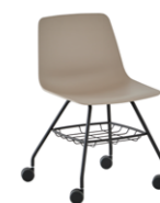
4 leg frame + casters + basket Pie 4 patas + ruedas + cesto

Gran parte de los productos de esta colección, cuentan con el certificado GREENGUARD Gold de UL Solutions.