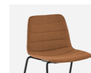
Horizontal stitching Costuras horizontales