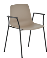
4 leg armchair stackable Sillón 4 patas apilable