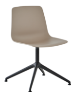
Aluminum swivel base Base giratoria de aluminio