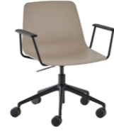
Aluminum swivel base + casters + gas lift + arms Base giratoria de aluminio + ruedas + gas + brazos