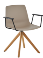
Wooden swivel base + arms Base madera giratoria + brazos