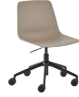
Aluminum swivel base + casters + gas lift Base giratoria de aluminio + ruedas + gas