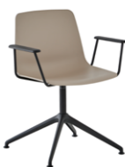
Aluminum swivel base + arms Base giratoria de aluminio + brazos