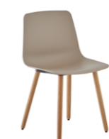
4 wooden leg frame Pie 4 patas de madera