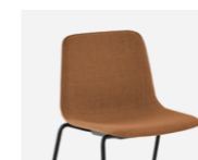
Plain upholstery Tapicería lisa