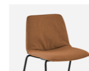
Soft upholstery Tapicería soft